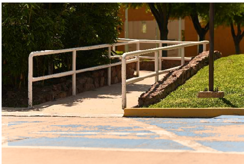
Figura 4. Rampas de acceso.