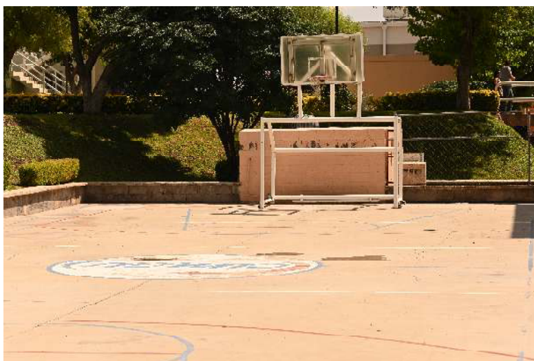
Figura 2. Instalaciones deportivas de uso común.