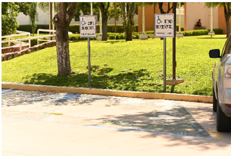
Figura 3. Cajones para discapacitados al frente del edificio principal.