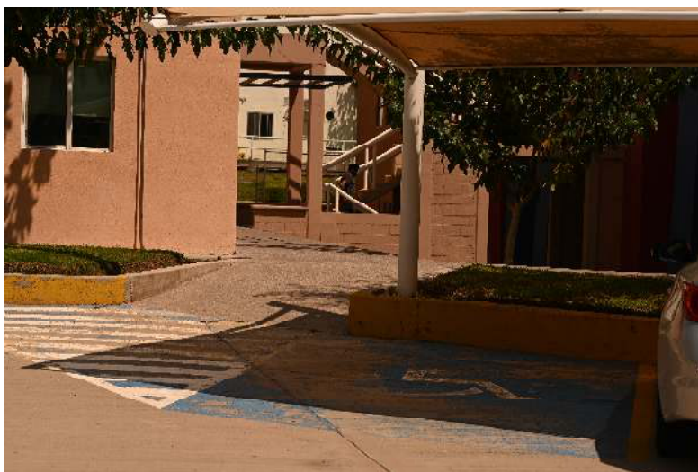
Figura 1. Cajones preferentes para discapacitados.

El presente documento muestra evidencia fotografía de las instalaciones. Incluyen medidas para estudiantes con discapacidad y para los estudiantes en general.