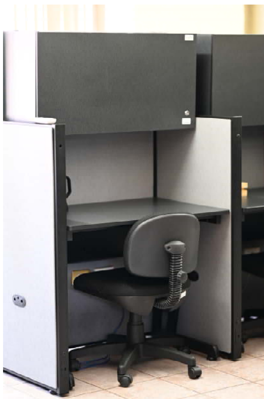
Figura 6. Existe áreas específicas con mobiliario para estudiantes, el cual se asigna de acuerdo a las necesidades del proyecto.