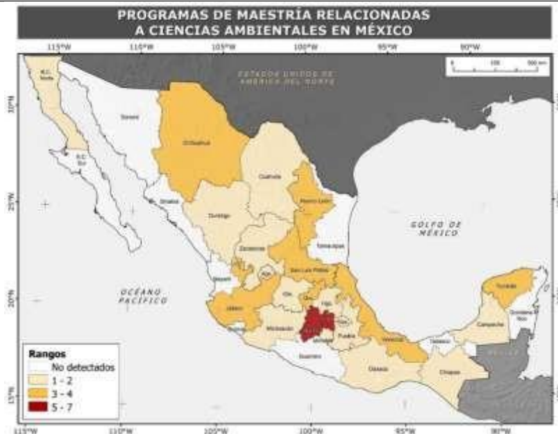
Figura 2. Distribución de Programas de Maestría relacionados a ciencias ambientales en México.